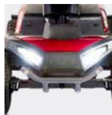
Luz led delantera