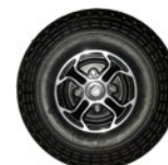
Rueda maciza trasera