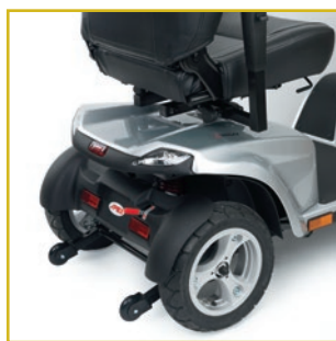
Suspensión trasera. Palanca de desembrague y ruedas antivuelco