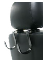
Colgadores para bolso