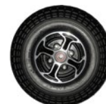
Rueda maciza delantera