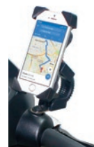
Soporte para móvil