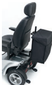
Bolsa trasera con portabastones doble