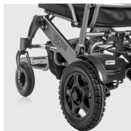
Nuevo sistema de mejora de extracción de la batería (Batería de 20, 30 y 40 Ah)