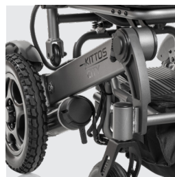
Nuevo sistema de fácil acceso para la conexión/ desconexión del motor